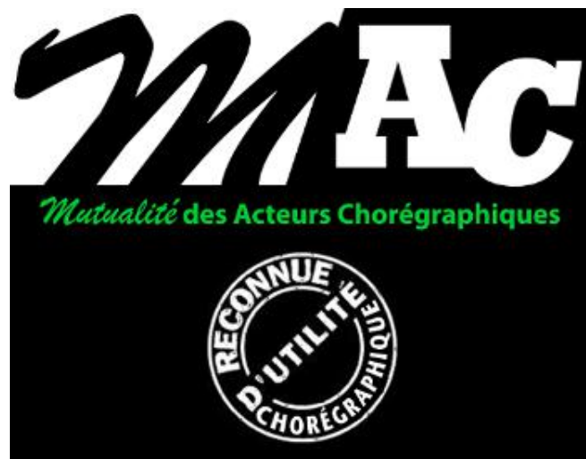
formulaire de pré-inscription

Rejoignez vous ! Renseigner le formulaire de pré-inscription en ligne , afin d'évaluer nos forces et de nous permettre de faire avancer l'initiative !